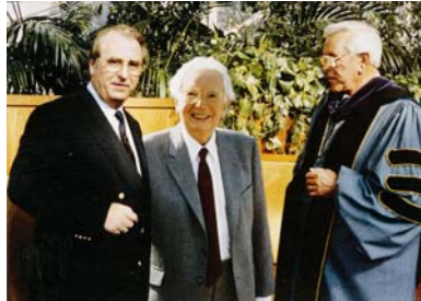
Nikolaus mit Viktor Frankl, dem wohl bedeutendsten Psychologen des 20. Jhd.